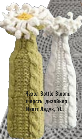
Чехол Bottle Bloom, шерсть, дизайнер Иветт Ладук, YL.