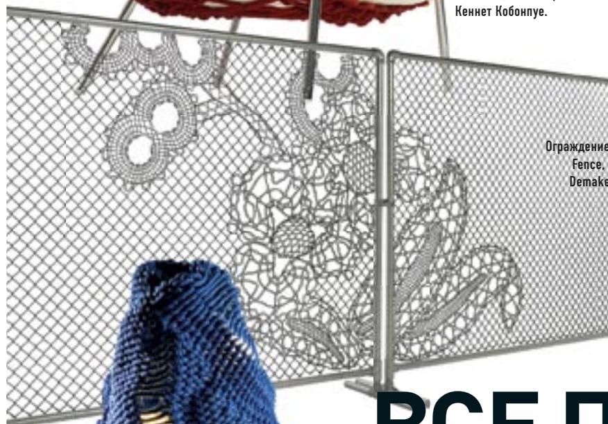
Ограждение Lace Fence, сталь, Demakersvan.